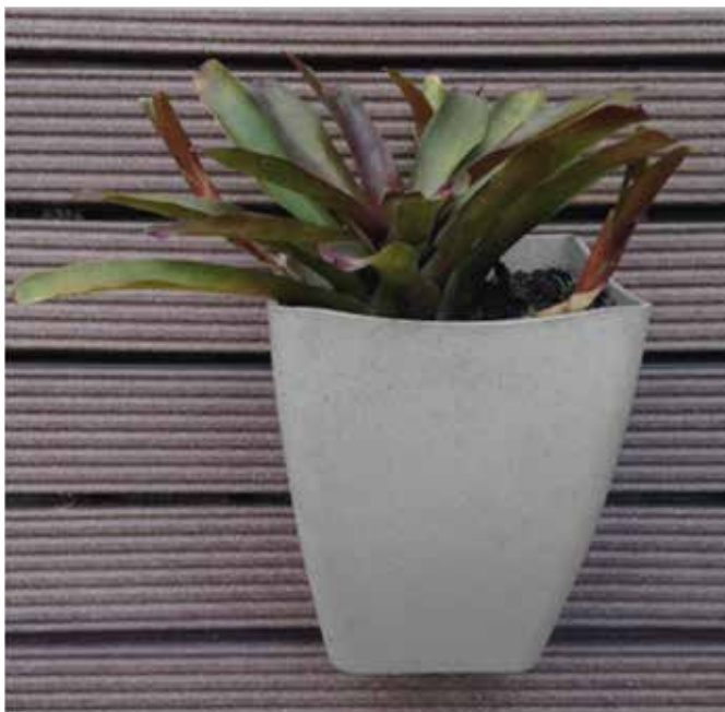
Vista frontal após montagem do conjunto.