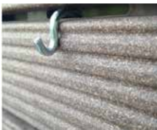
Posicionamento do gancho em formato "S" no Deck Modular Plástico.

10- Para a instalação dos vasos, escolha a disposição desejada e utilize os ganchos para pendurá-los no Deck Modular Plástico da seguinte maneira: