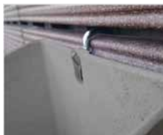
Cachepô de parede pendurado no gancho.