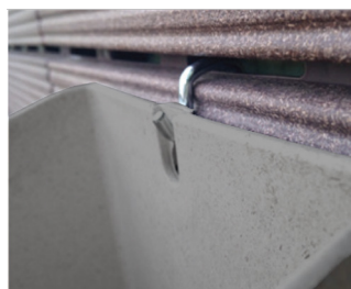
Cachepô de parede pendurado no gancho.