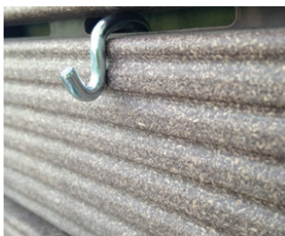
Posicionamento do gancho em formato "S" no Deck Modular Plástico.

10- Para a instalação dos vasos, escolha a disposição desejada e utilize os ganchos para pendurá-los no Deck Modular Plástico da seguinte maneira: