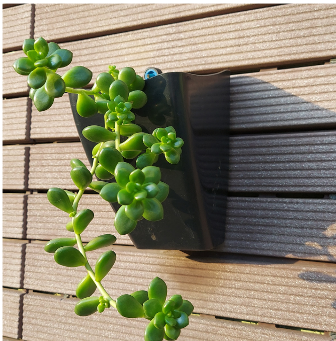
Vista frontal após montagem do conjunto.